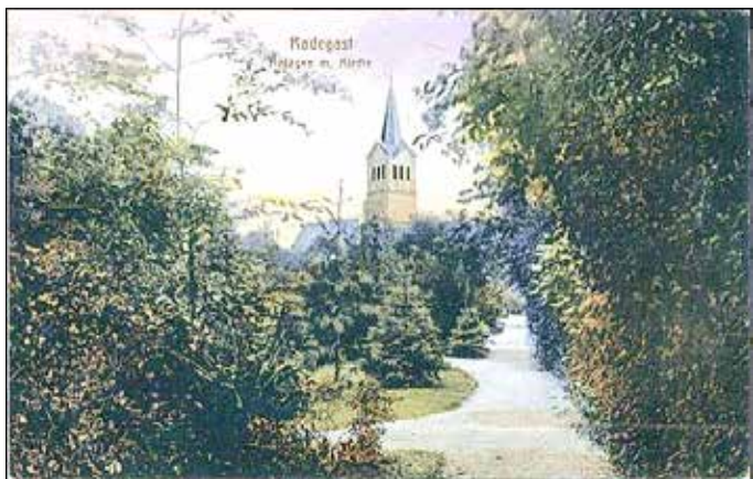
Alte Friedhofsparkanlage in Radegast.

Im April 2020 wurde ein Pachtvertrag für den Friedhofspark in Radegast unterzeichnet. Das Grundstück ist Teil des Friedhofes und stellt eine brachliegende nicht mit Gräbern belegte Grünfläche dar.