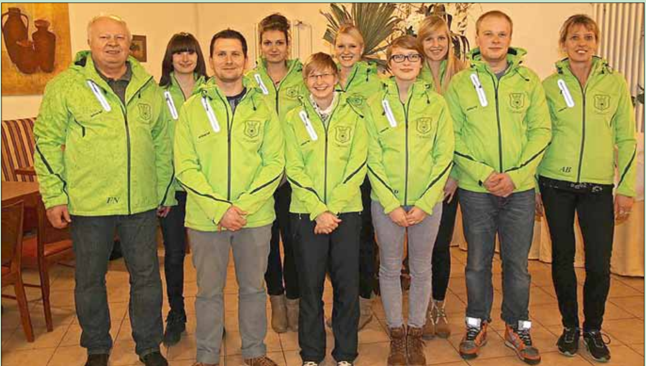
Aufsteiger in die 1. Bundesliga Sportschießen Luftgewehr 11. Januar 2015

Landesleistungsstützpunkt Sportschießen Sachsen-Anhalt