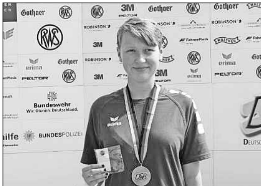
Siegerehrung DM München 2013