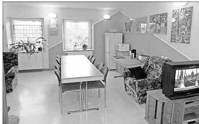
Klubraum Jugendclub „Freizeitoase“ Edderitz

Die Freizeitoase in der Ernst-Thälmann-Straße 48 im Ortsteil Edderitz verfügt in der unteren Etage über einen Mehrzwecksaal und einen Klubraum , welche für öffentliche Veranstaltungen und für private Feierlichkeiten zur Verfügung stehen. Im Mehrzwecksaal können größere Feiern mit bis zu 100 Personen ausgerichtet werden. Der Klubraum steht für kleinere Feiern zur Verfügung. Mit ca. 20 Personen kann man hier gemütlich feiern. Eine Küche mit Geschirrspüler und Geschirr, in unmittelbarer Nähe, kann für beide Räume genutzt werden.