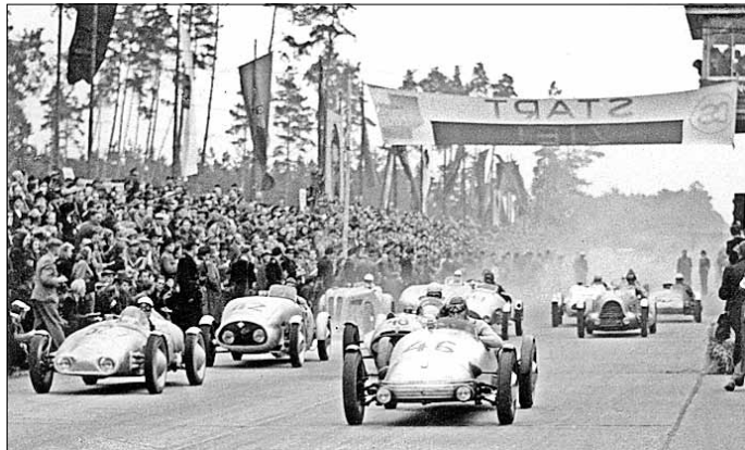
Dessauer Rennstrecke Autorennen 1950

Text kursiv ergänzt Kulturregion Anhalt & Bitterfeld e.V.