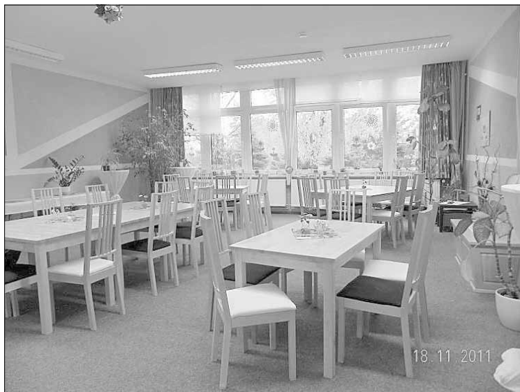
Offener Treff im Mehrgenerationenhaus Görzig

Ab 2012 werden die Kurse Malen, Basteln, Töpfern, Handarbeit, Kinderturnen, Computer, Kochen und Schulsanitätsdienst weitergeführt. Auch das traditionell monatlich stattfindende und gut besuchte Familienfrühstück wird es weiterhin geben und interessante Vorträge zu verschiedenen Themen. Auch im neuen Förderprogramm des Mehrgenerationenhauses der Stadt wird der generationenübergreifende Ansatz im Mittelpunkt stehen. Darüber hinaus sind die Voraussetzungen geschaffen, das weitere neue Angebote entwickelt werden - z. B. der Einsatz von Bundesfreiwilligen im Mehrgenerationenhaus. Eine weitere wichtige Aufgabe ist die Unterstützung von benachteiligten Kindern. Ziel der Verantwortlichen ist es, dass das Mehrgenerationenhaus Görzig für alle Bürgerinnen und Bürger der Stadt Anlaufpunkt wird.