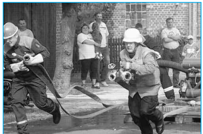
Kameraden beim Löschangriff „nass“