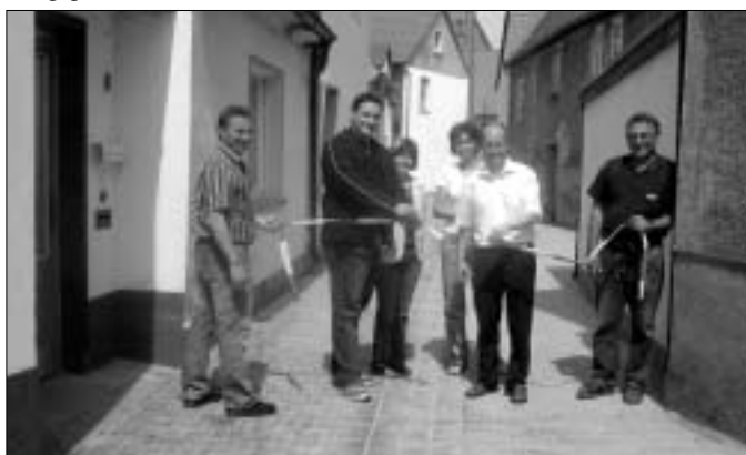
„Hier auf dem Foto erfolgte die Bauabnahme „Auf dem Berge“. Die Gröbziger kennen den alten Zustand dieser engen Straße. Die Oberfläche dieser Straße wurde mit Altstadtplaster befestigt und vor allem sind es die Anlieger, die sich über die neu gebaute Straße freuen. Das Ergebnis kann sich sehen lassen. Die Bauprojekt Gröbzig GmbH, Sitz Köthen Herr Hausmann als Planer und auch die ortsansässige bauausführende Firma HTS Bau GmbH haben sehr gute Arbeit geleistet.“

Die Maßnahmen wurden zu 75 % aus Mittel des Europäischen Fonds für Regionale Entwicklung (EFRE) gefördert. Die restlichen 25 % werden zu 50 % im Rahmen der Stadtsanierung gefördert, sodass der Eigenanteil der Stadt Gröbzig für diese Baumaßnahmen 12,5 % beträgt. Die Maßnahmen sind bis auf geringfügige Restleistungen fertig gestellt.